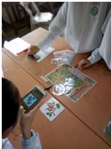
Rajah 2 : Pemain menggunakan aplikasi UniteAR untuk mengimbas pada gambar sasaran