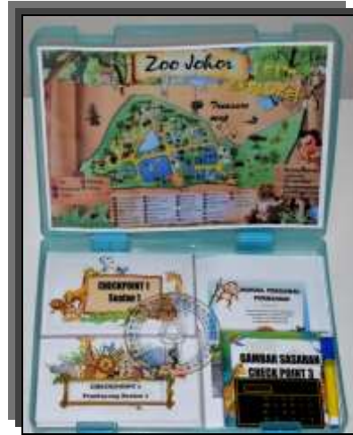
Rajah 1 : Set Kit Pengembara

Seterusnya, penerangan permainan di setiap checkpoint diterangkan dalam jadual 2 dibawah.